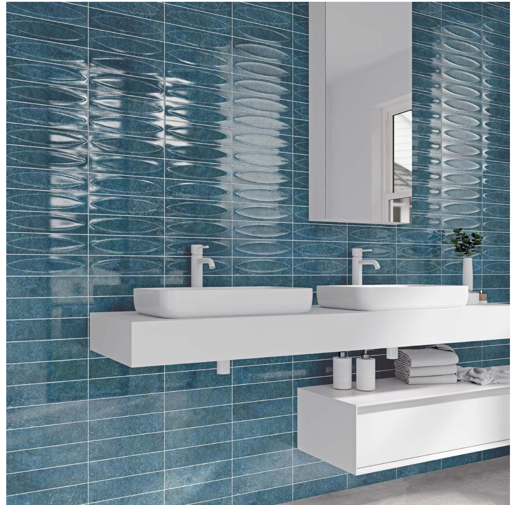
Majorica Azul & Azul Base