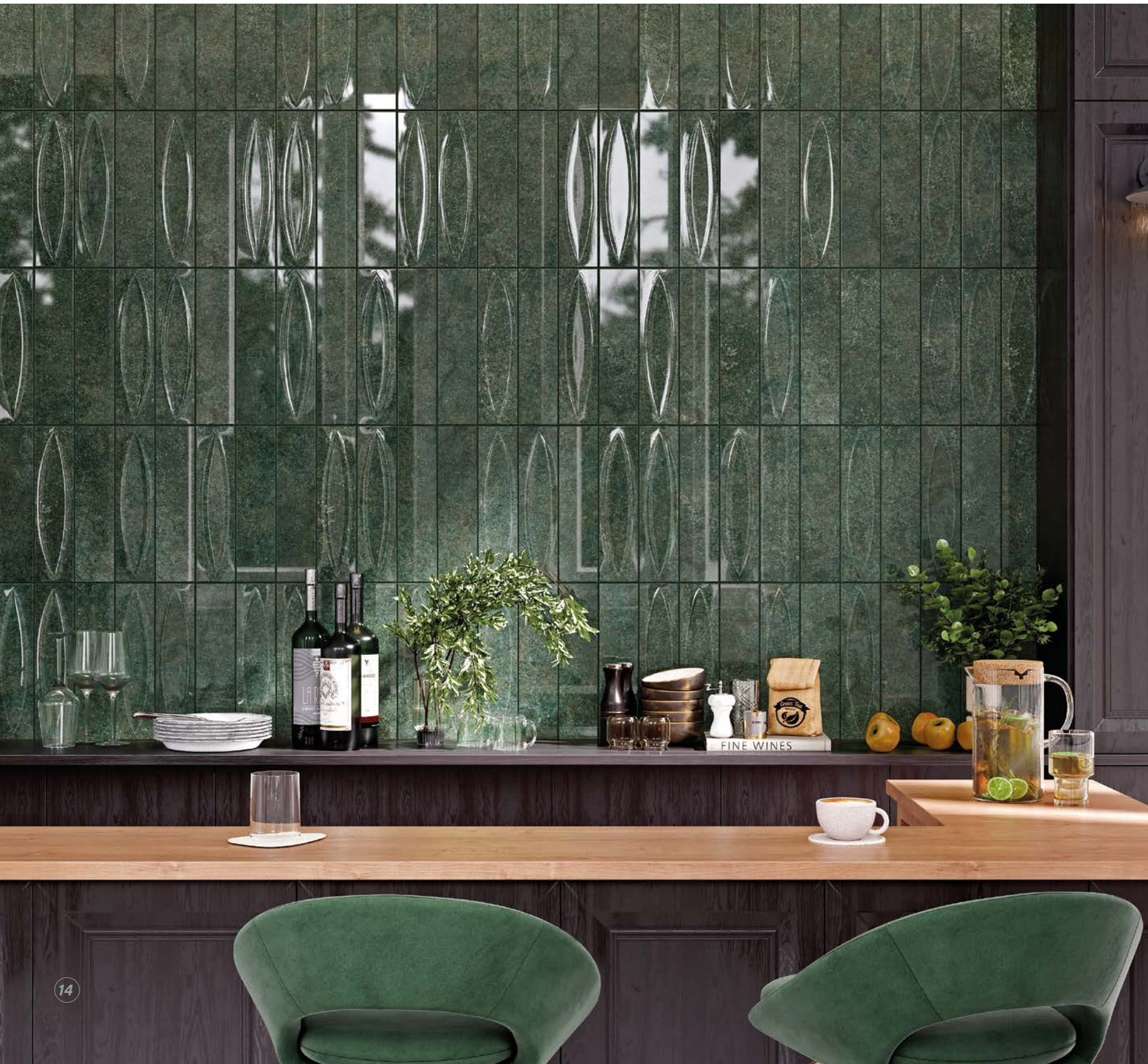
Majorica Verde & Verde Base