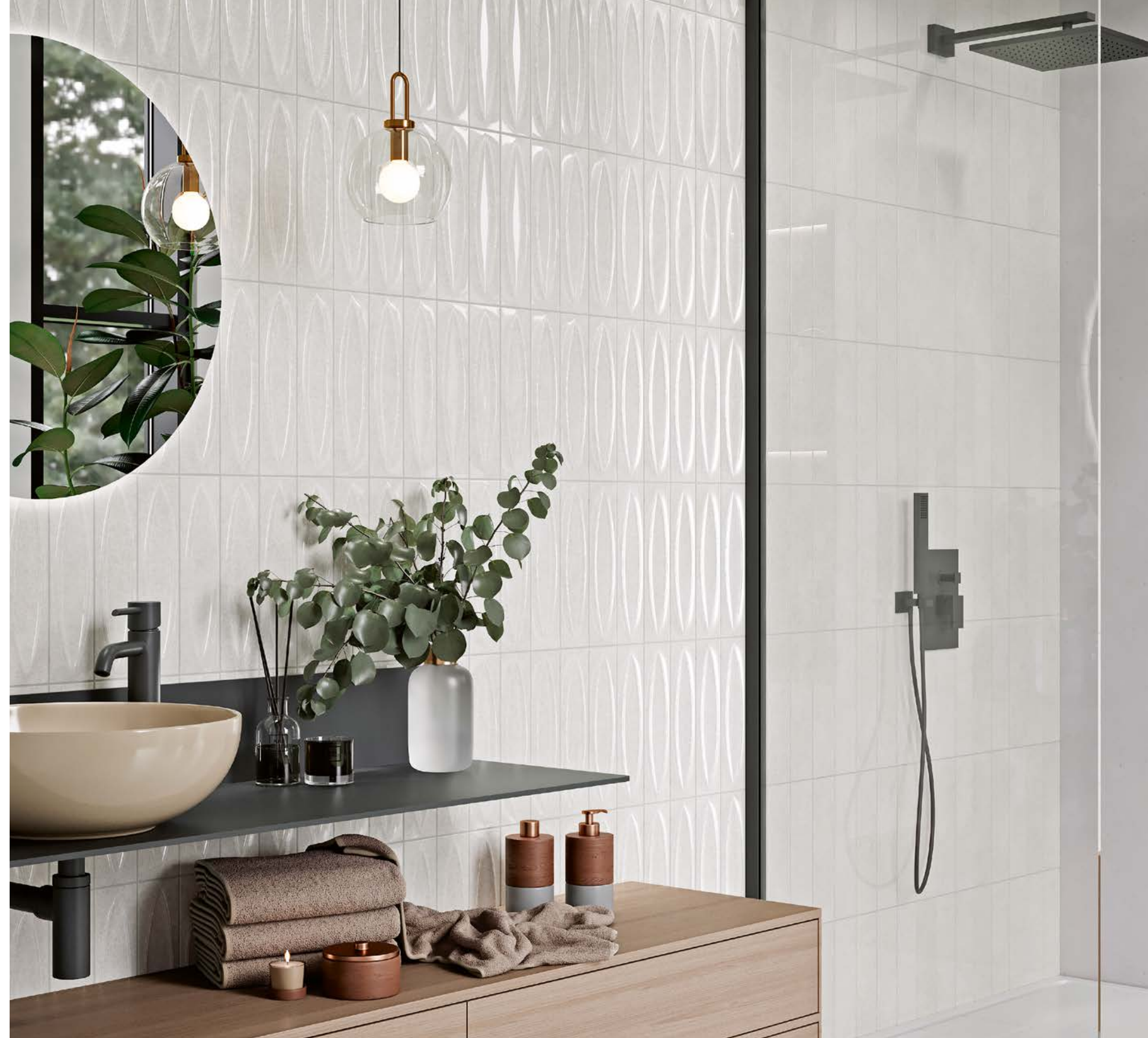
Majorica Neutro & Neutro Base