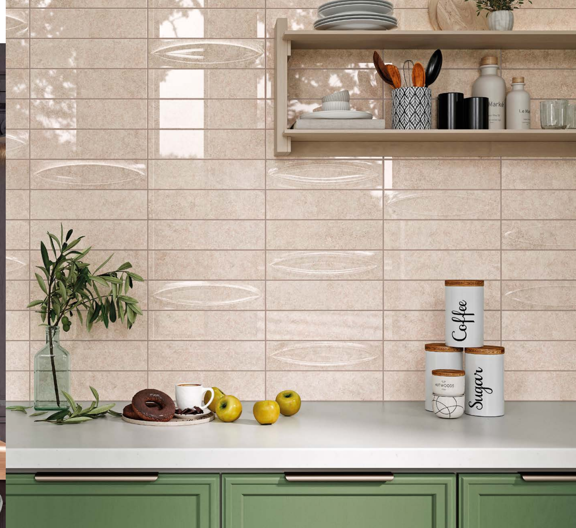
Majorica Beige & Beige Base