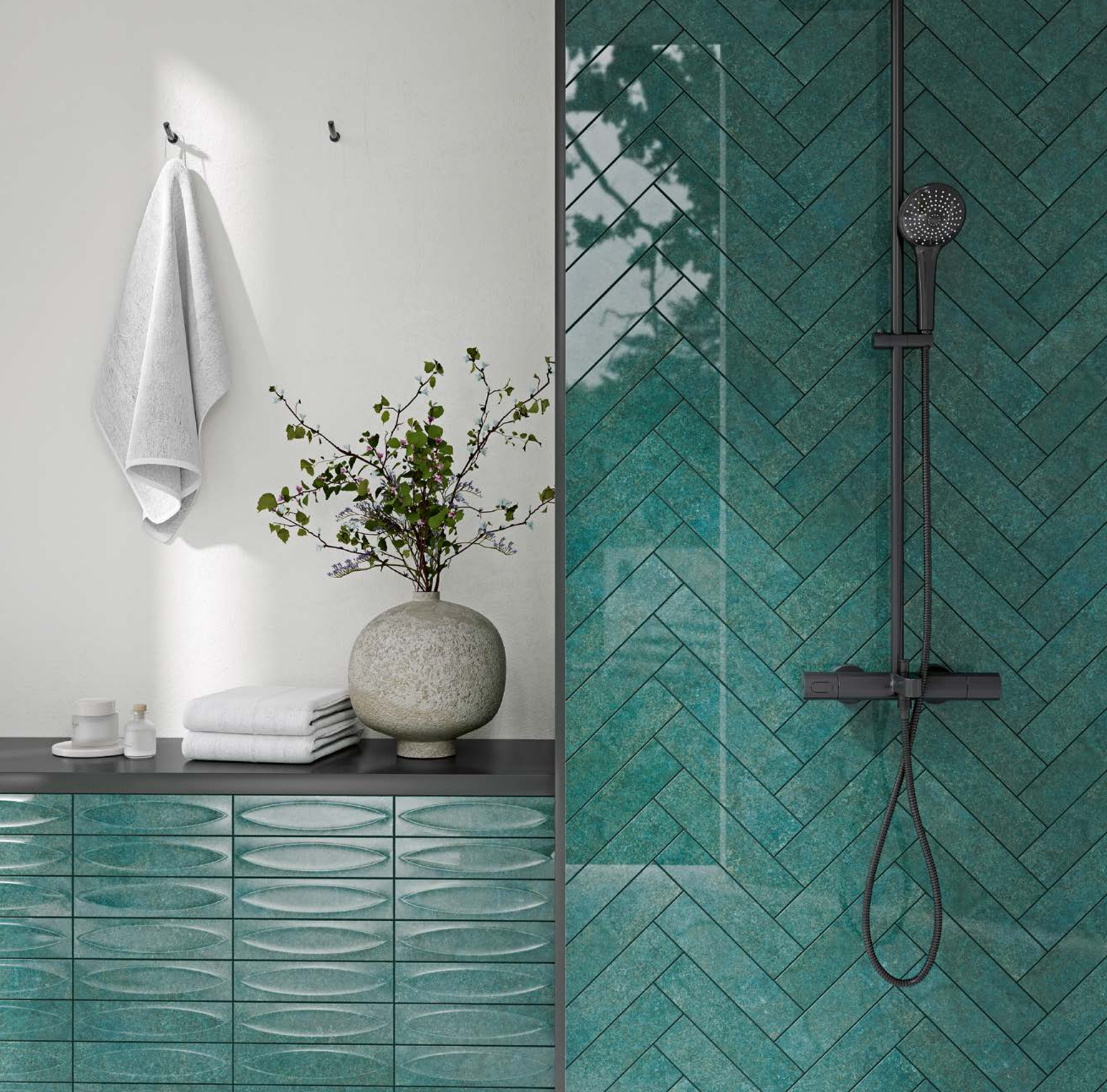
Majorica Teal & Teal Base